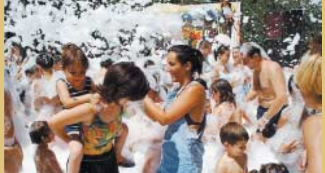
Nens i nenes durant la festa de l'escuma)

cats va ser l'actuació del Grup DeCajón, grup que ha participat en el Festival Internacional de Música Ètnica i al GREC-99 de Barcelona. El públic va acollir amb entusiasme aquesta mescla experimental de jazz i flamenc on el ball, el saxo i la flauta travessera en són protagonistes.