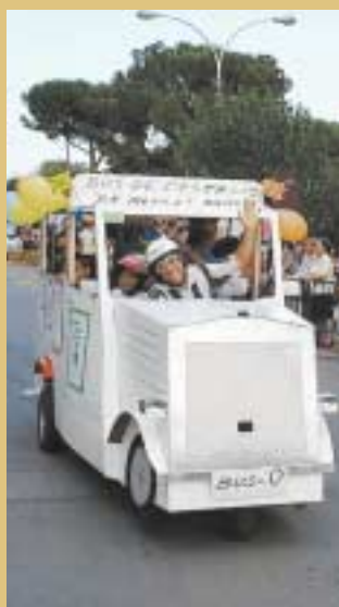
Un moment de la baixada de l'autobús de l'estació