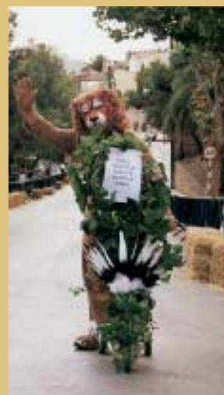
La lleona més divertida