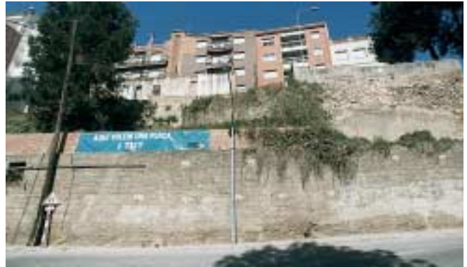
Carrer Major, lloc on s'ha previst construir els habitatges

porta l'Ajuntament del Papiol des de que es van constituir els ajuntaments democràtics" . A més a més, també manifesta estar "content perquè hem aconseguit que els nous habitatges es facin al centre de la vila i no en la perifèria, com és habitual en aquest tipus de vivendes" . La construcció dels habitatges començarà l'any que ve i cap a finals del 2002 els joves podran accedir a la seva adquisició a preus tassats.