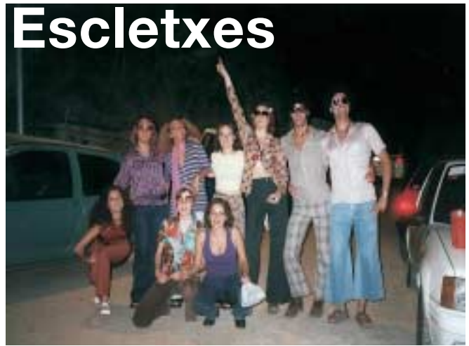
El Grup de Teatre-Poesia posa a Les Carpes del 1998

Sí, vam representar "Terra Baixa", una de les millors obres d'Àngel Guimerà en l'homenatge a Alexandre Figueras el 1992. Ell sempre ens deia que no seríem