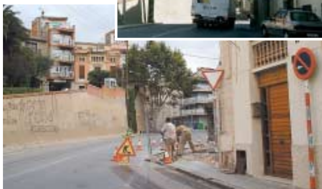
Obres a l'espai que ocupava la casa