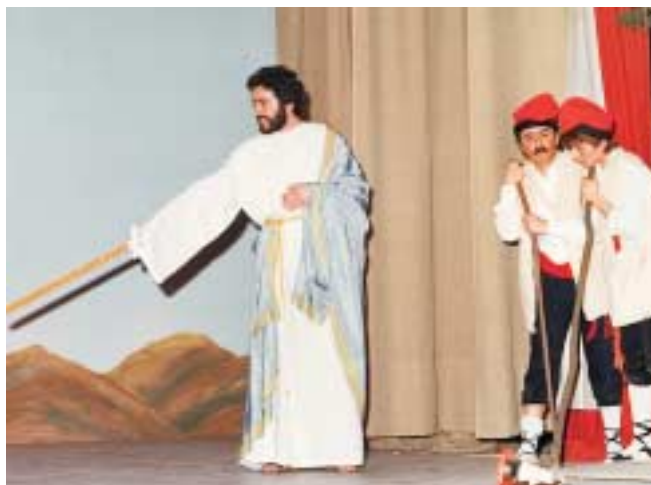
Un moment de l'obra "Els Pastorets"

Llegim algunes peces i triem l'obra en funció del