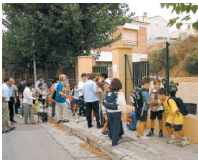
Els nens i nenes entren a l'escola