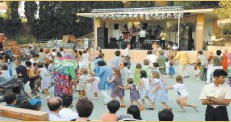
Infants participant al Ball infantil

La Festa Major-2000 del Papiol ha superat amb escreix anteriors edicions. Com sempre ha comptat amb la participació d'entitats ciutadanes i com no, del conjunt de persones que formen la Comissió de Festes. Aquest any, la Festa Major es va obrir amb el cinema a la fresca. Es va projectar la pel·lícula La Trampa . La gran quantitat d'assistents coincidien a opinar que "havia estat una idea molt divertida i una bona iniciativa fer una sessió de cinema a l'aire lliure" . La majoria creuen que "s'hauria de repetir més sovint a l'estiu" .