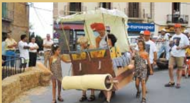
La família "Picapedra" amb el seu Troncomòbil