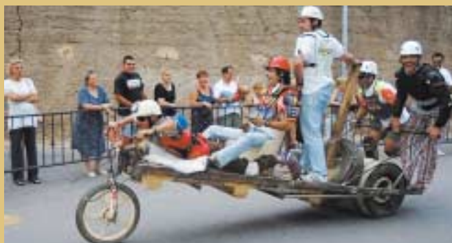
Un grup de joves amb el gran tricicle que van dissenyar