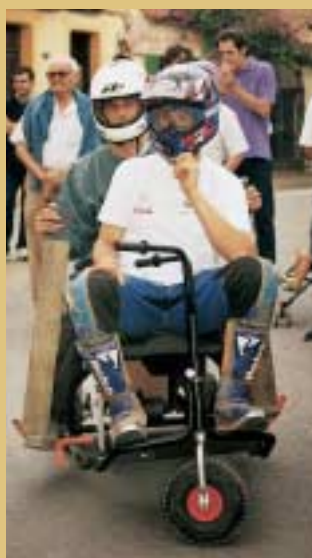
Els ocupants precisaven casc per baixar en aquest dos models de cotxes "inimaginables"