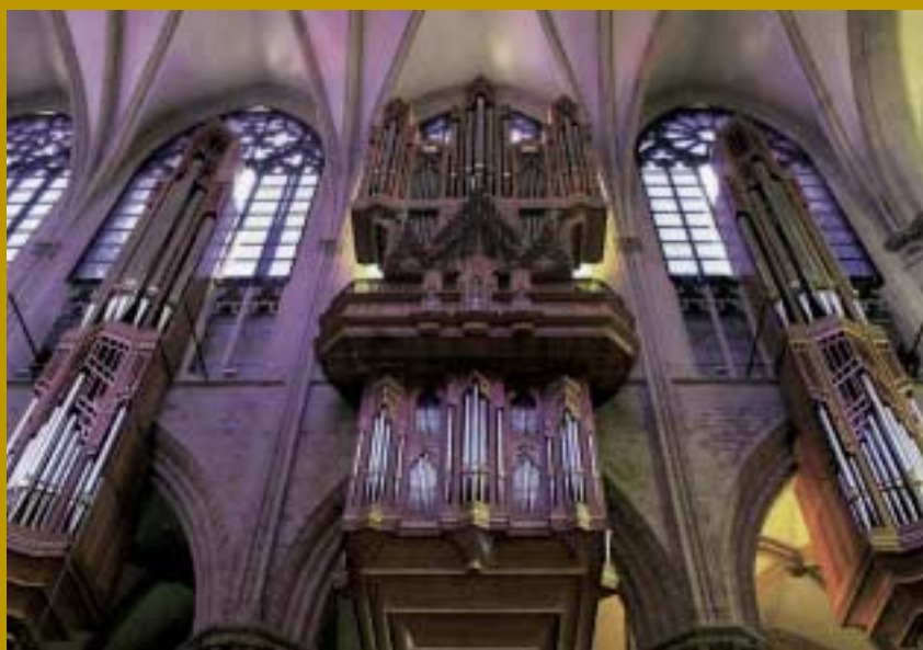
L’orgue a la Catedral de Saint Michel