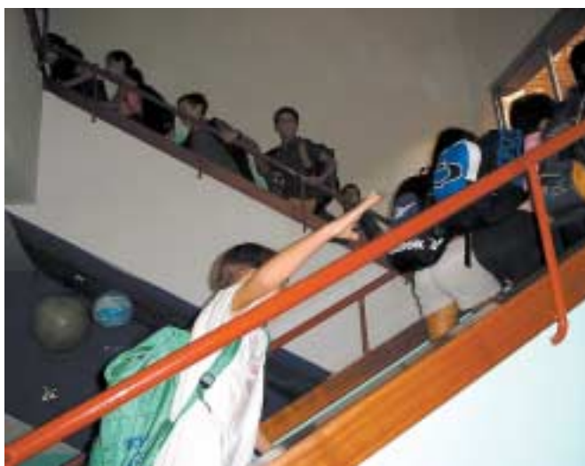
Els infants emprenen el camí cap a les seves classes