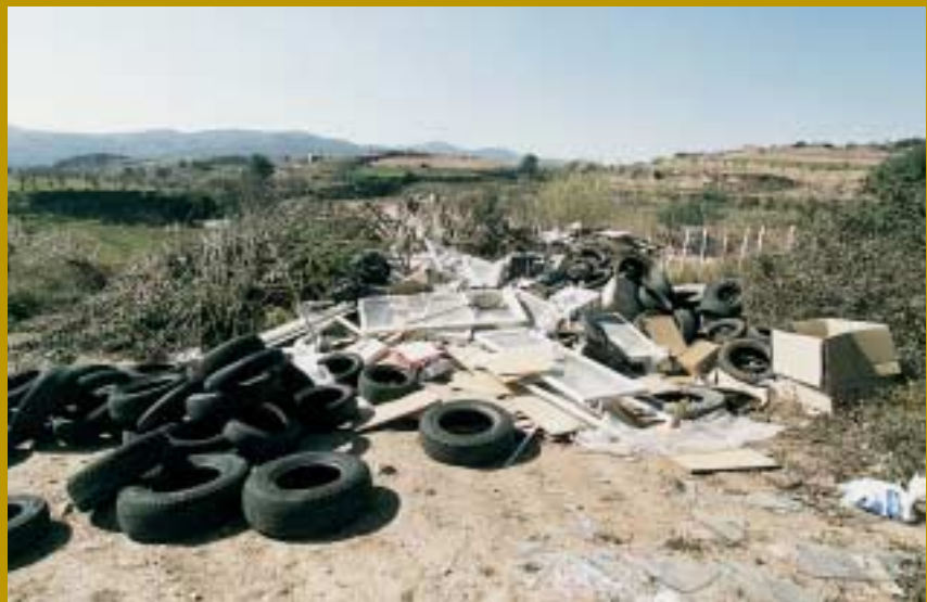
Estat en que es trobava l'antic abocador

L'antic abocador municipal s'ha buidat de deixalles i s'ha convertit en un solar sanejat. L'Ajuntament ja no fa cap ús municipal d'aquest espai ja que ara els residus es porten a la deixalleria. El buidat d'aquesta zona s'ha fet mitjançant el procediment habitual de reciclatge dels residus dipositats.