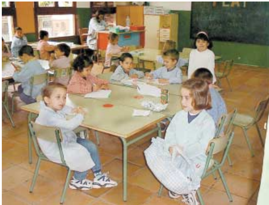
Infants de quatre anys a la classe

"Els infants que han de començar el parvulari haurien d'anar el trimestre anterior a la guarderia"