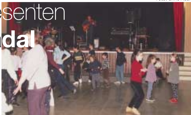
Un moment de la festa