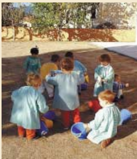
Els petits al pati de l'escola