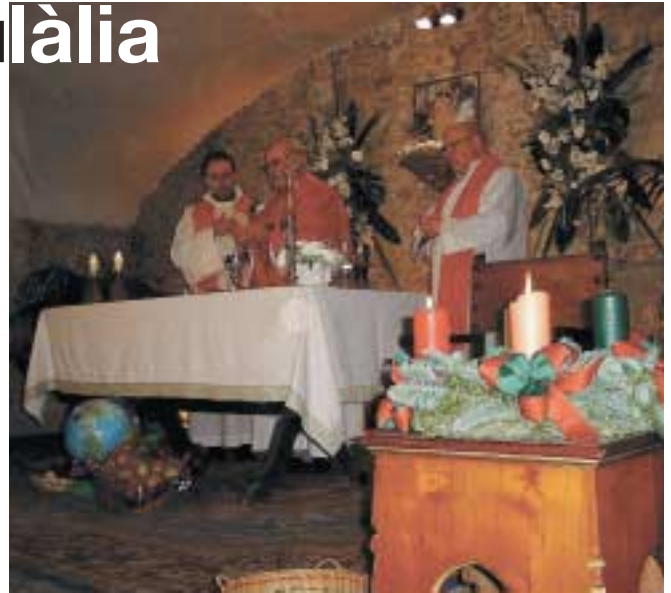
Missa al Castell

La Cobla de Terrassa va sorprendre agradablement al públic assistent amb l'excel·lent interpretació de sardanes i altres danses populars.