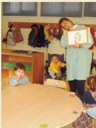
Tots a cantar