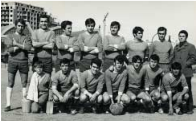
Temporada 78. Campió de grup d'Educació i Descans

amb el seu esforç aconseguiran ocupar un lloc a meitat de la taula com l'any passat però mantenir-nos a la categoria és el nostre objectiu prioritari". Aquesta mala ratxa es deu principalment, segons el seu president a que "tenim més problemes que altres equips més grans i el principal és que tenim pocs jugadors i les hores d'entrenament, quatre a la setmana, moltes vegades no són suficients i a més a més mai hi són tots. Malgrat això, hem d'intentar que aquest club subsisteixi per això estem esperant que alguna persona se'n faci càrrec del club econòmicament per veure si així podem garantir la nostra permanència"