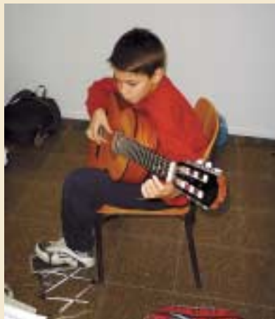
Classe de guitarra

"Hem pogut iniciar noves i necessàries assignatures com el Cant Coral i crear un departament de corda que començarà a funcionar el més de gener amb l'aprenentatge del violí"