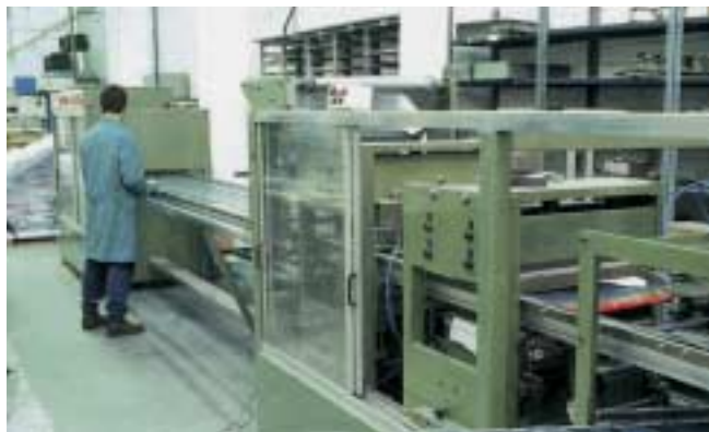
Empresa Miton S.L.

Centre de Promoció Econòmica Joan García Nieto estan dintre d'un programa de formació, orientació i inserció laboral destinat a joves aturats de 16 a 24 anys. La durada dels tallers és de