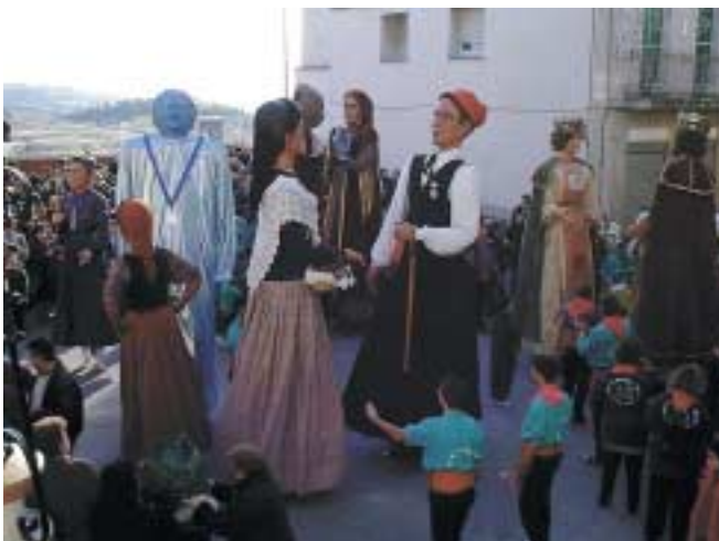
Ball de geganters