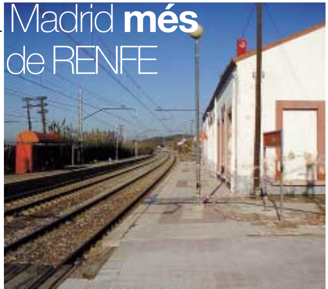
Estació de RENFE

Al marge d'aquesta visita a Madrid el projecte que havia aprovat Renfe fa mesos que s'està aplicant. Actualment, les obres estan en una primera fase, en la que s'ha previst instal·lar una nova