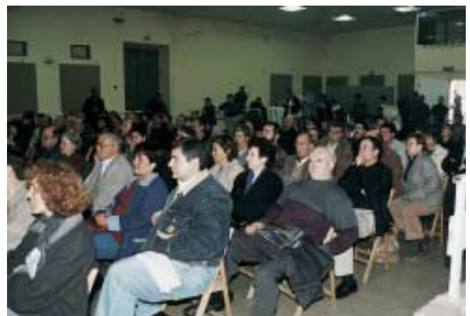
Unes 260 persones van acudir a l’acte