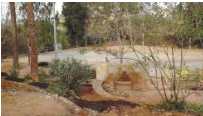
Bosc del Blanc

destinats als més menuts i substituiran els elements actuals amb l'objectiu de proporcionar un espai millor equipat i més segur pels infants del poble.