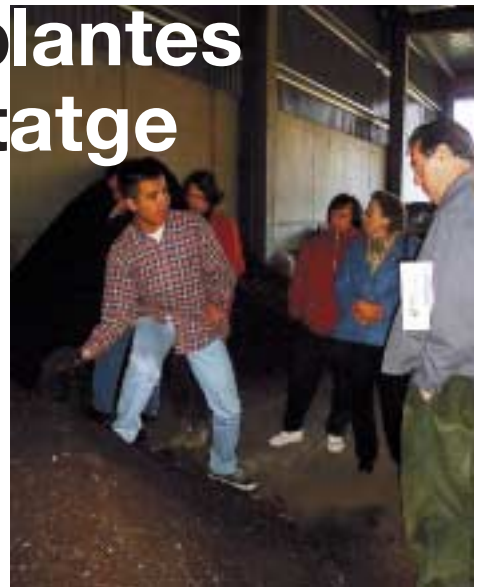
Planta de Compostatge de Sant Cugat

Cugat del Vallès. Aquesta sortida va estar organitzada per la Comissió Anti-deixalles amb la col·laboració de la regidoria de Medi ambient. Els assistents van poder comprovar a la planta de Molins el sistema el triatge de les deixalles i van poder conèixer la importància que té el fet de separar la brossa orgànica dels plàstics, del paper o de les llaunes a les nostres llars. Després d'un esmorzar popular a la plaça de l'Ajuntament de Molins amb