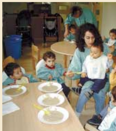
L'hora de dinar