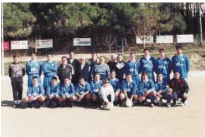
Temporada 98-99. Campions de grup i ascens a Segona Regional

"La Junta se sent orgullosa de que més enllà dels triomfs esportius ha forjat grans persones"