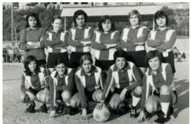
Les dones també van formar un equip la temporada 74-75