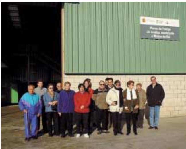
Els assistents a la planta de Triage de Molins de Rei

motiu de l'inici de la campanya "Fem menys deixalles", l'excursió va finalitzar a la planta de Compostatge de Sant Cugat on van mostrar el procés d'obtenció d'adob natural mitjançant una mescla de matèria orgànica i vegetals.