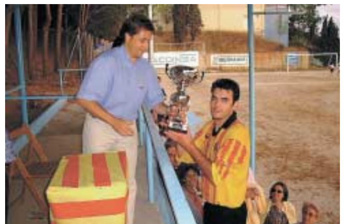
L'Alcalde lliura el premi a la Festa Major del passat estiu