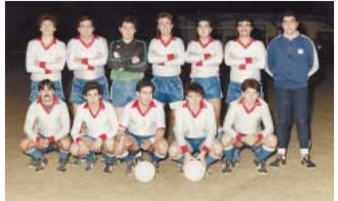
Equip de la temporada 84-85

realitza algunes activitats fora de la pràctica esportiva, que en moltes ocasions serviren per fer front a les vaques flaques. Aquest va ser el primer any que "es van vendre participacions de loteria i també es va instal·lar propaganda comercial que va fer augmentar considerablement els ingressos del club". A mitjans del 80, vam introduir el bingo de la Festa Major, perquè el club també passava moments molt crítics econòmicament. Des d'aleshores aquest bingo ja s'ha institucionalitzat". Altres activitats com ara la guerra de l'aigua també a la Festa Major