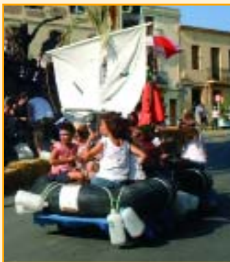
Mar endins s'en va la barca

vehicles al públic al carrer. Us mostrem un seguit de fotos on un autocar, un escarbat, uns quants "balseros" naufragats, entre d'altres enginys mecànics, van baixar a tota pressa per l'Avinguda Generalitat fins al Bosc del Blanc.