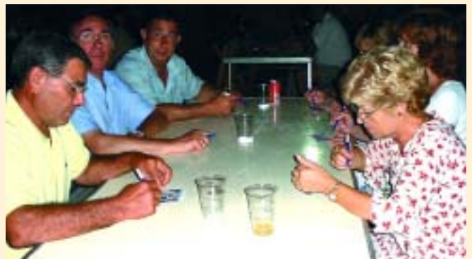
Molts dels papiolencs van acabar la nit al Bingo