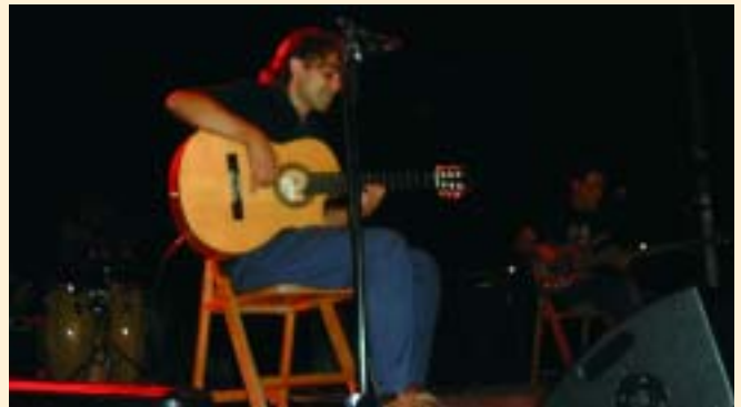
El grup "Gazpacho" va oferir una sessió de flamenc

La nit inaugural es va completar amb l'actuació del grup "Gazpacho", que va oferir als assistents una fusió de flamenc i ritmes llatins. Mentrestant al Casino, es va celebrar el Bingo de Festa Major organitzat cada any per FC. El Papiol.