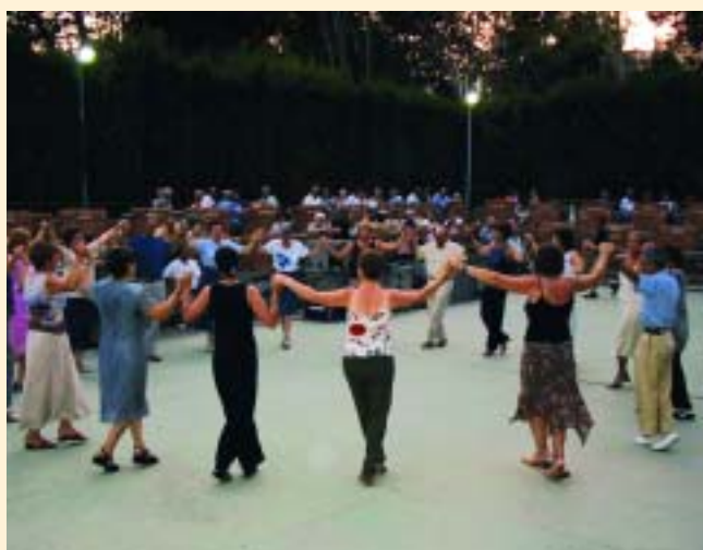
L'orquestra va interpretar música de la cultura catalana i després van tocar unes quantes sardanes