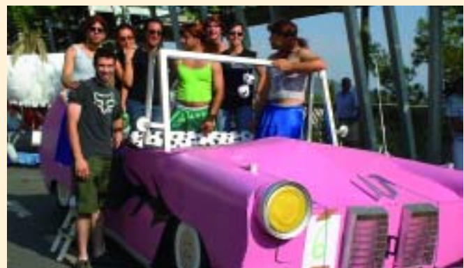
Los grises" més roses