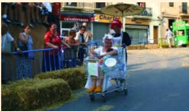
Uns "Carrozones" molt ben crescutets