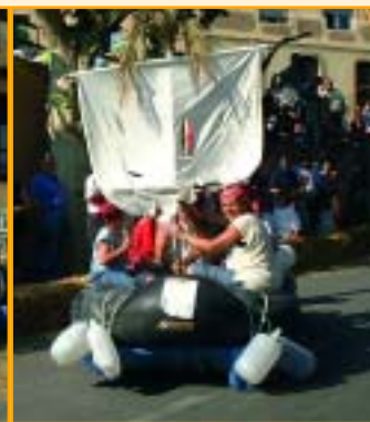
Mar endins el Vell Pescador