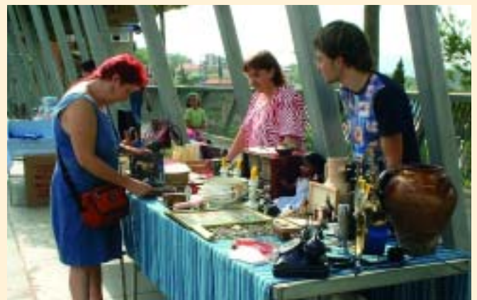
Objectes d'ahir i d'avui es van donar cita en aquest dia

promotora de la mostra, "podem fer una valoració molt positiva d'aquesta primera trobada, ja que els expositors estan molt contents del resultat i ha tingut una bona rebuda entre la gent del poble. Espero que l'any que ve hi hagin més parades".