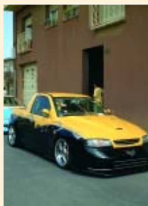
Aquesta I Trobada va aplegar més de 70 cotxes