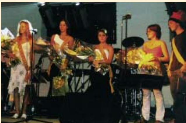
Aquest any la Pubilla va participar a més actes de la festa