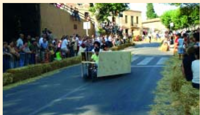
El formatge a punt de fondre's en un dia molt calorós