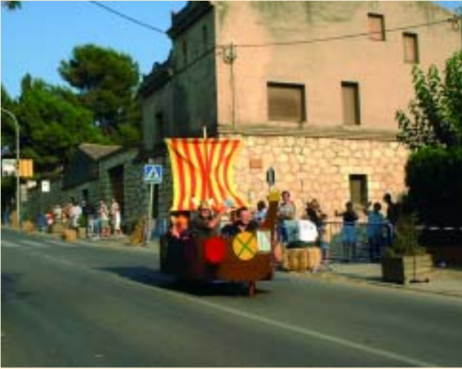
"Els Vikings" van navegar per l'Avinguda de la Generalitat