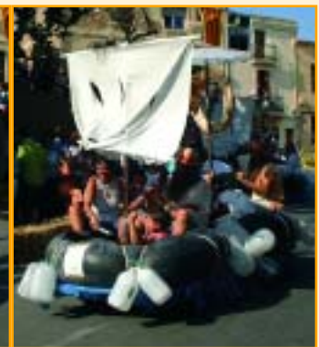
Mar endins EL pescador