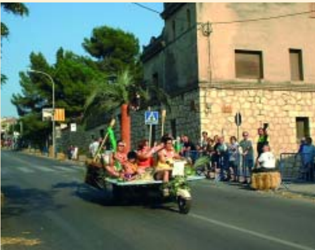
Hawaiï va visitar-nos en aquest vehicle tan "platgero"