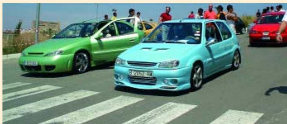
El Tunning consisteix en guarnir cotxes i és un hobby un pèl car