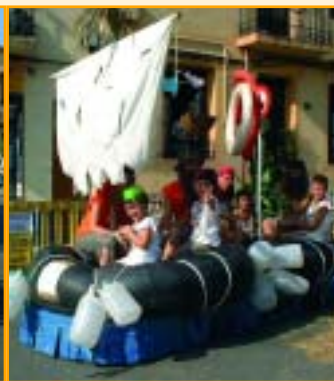
Mar endins la Vella barca