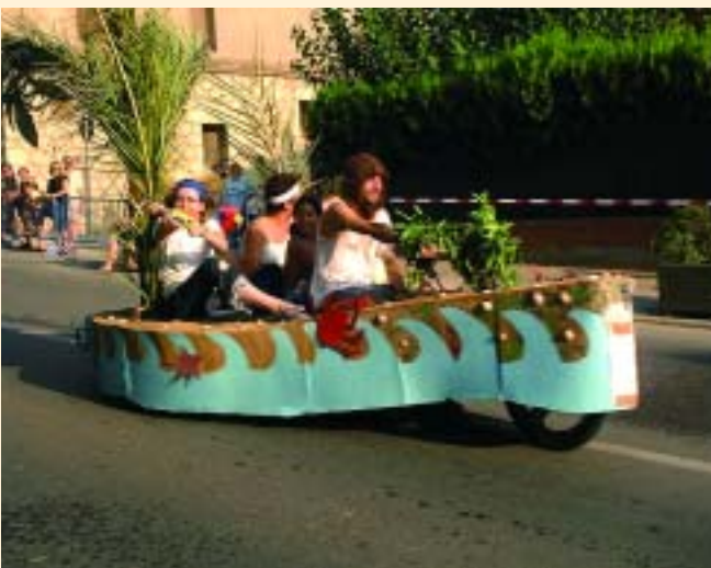
;X00000000000FF00000! Ja hem caigut a l'aigua!