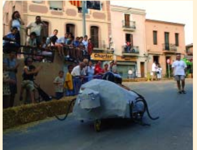
Un escarbat gegant van dominar els carrers del Papiol per uns moments