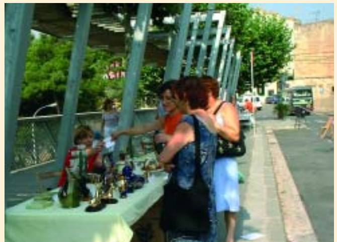
La I Trobada de BrocanTERS va ser tot un èxit