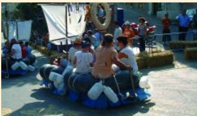
Els balseros van convertir la carretera en un mar ple de naufragats