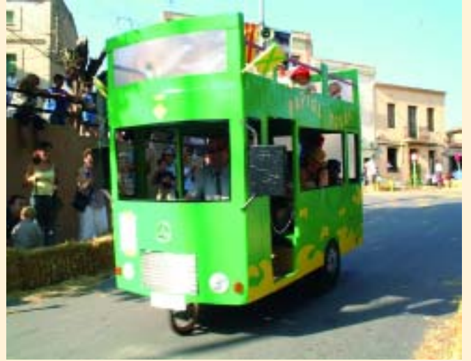
El "Papiol-Tours" va fer una visita turística pel poble