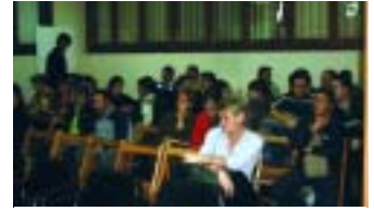
Es van aplegar unes 60 persones

El passat dimarts 25 de novembre, es va celebrar a la Sala de Plens del Consistori, el sorteig dels 14 habitatges de promoció pública promoguts per l'Ajuntament del Papiol i gestionats per l'IMPSOL. El sorteig públic va aplegar unes 60 persones, de les quals 29 optaven a un dels 14 habitatges.