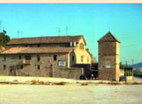
Masia Can Colomer