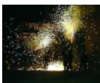
Actuació dels Diables