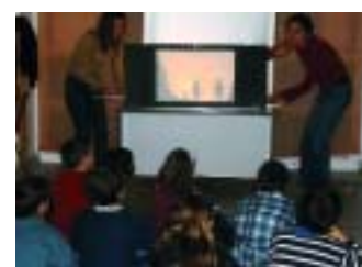
L'Hora del Conte es va celebrar al Centre de Lectura