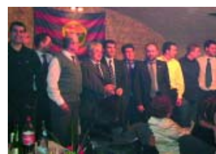
Joan Laporta amb membres de la Junta de la Penya Blaugrana