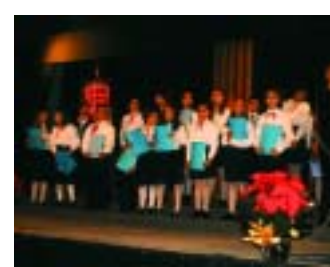
Concert de Tardor