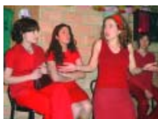
Els monòlegs van tenir molt d'èxit entre els assistents

La Festa Major d'Hivern, amb motiu de la patrona Santa Eulàlia, s'ha celebrat aquest any els dies 12, 13 i 14 de desembre. Com a novetats d'aquest any s'han incorporat activitats organitzades per les Penyes del Papiol: el divendres 12 de desembre els monòlegs a càrrec del grup de Teatre Andròmina; el dissabte 13, la Nit de Penyes i el diumenge 14 de desembre, una Botifarrada popular a la Bòvila del Casc. Entre d'altres actes, també es van celebrar les litúrgies religioses, un espectacle de foc dels Diables, l'Hora del Conte al Centre de Lectura, Sardanes i el Concert de Tardor a càrrec de la Coral La Perdiu.