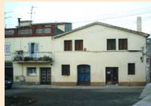
Plaça Prínceps d'Espanya