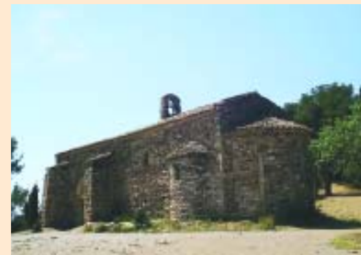
Ermita de la Salut