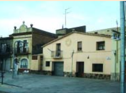
Plaça de Joan Fuster