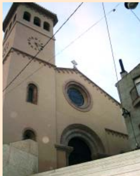
Estació de Setmana Santa