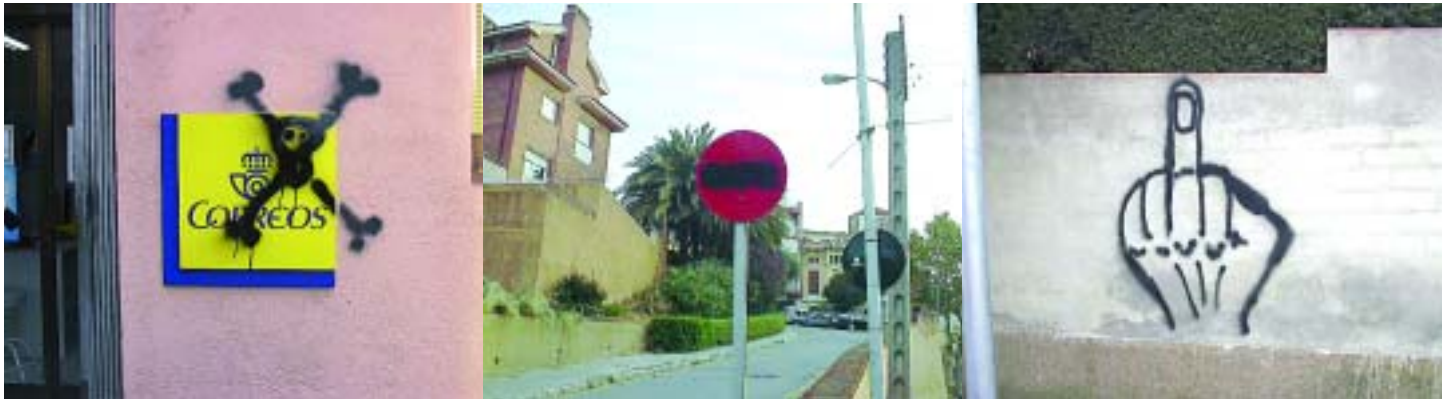
Pintades realitzades presumiblement pels dos joves

La nit del dimarts 2 de novembre, a las cinc de la matinada, la Policia Local del Papiol va identificar a dos joves menors d'edat que presumiblement estaven realitzant pintades amb spray a diferents edificis del poble. Un agent de la policia que patrullava pel carrer Barcelona va veure els