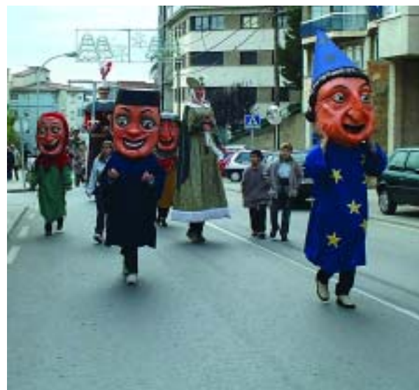
Imatge de la Festa Major Hivern de l'any passat

Com cada any, la Festa Major d'Hivern es celebra coincidint amb la festivitat de la patrona del nostre poble Santa Eulàlia. Enguany les Festes tindran lloc al llarg dels dies 9, 10 i 11 de desembre. Els actes adoptaran una significació especial ja que l'Ajuntament aprofita aquests dies tan senyalats per celebrar els 25 anys d'Ajuntaments Democràtics. En una sessió on assistirà tota la corporació municipal es farà el lliurament de les insignes commemoratives a tots els regidors i regidores que han contribuït a la tasca política dins l'Ajuntament del Papiol. A més d'aquest acte, al programa de la Festa Major d'hivern hi ha previst la Missa Solemne a la parròquia del poble, les sardanes de diumenge al matí amb la Cobla Canigó, el Concert de Tardor de la Coral la Perdiu així com també enguany, de forma especial, la inauguració de la Seu Social de la Penya Barcelonista del Papiol al Carrer Abat Escarré.