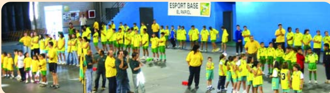
Imatge de la desfilada dels equips d'esport Base del Papiol

El passat cap de setmana del 6 i 7 de novembre van començar la primera fase dels jocs escolars en els que participen els equips de l'esport base del Papiol. Enguany compta amb 3 equips de bàsquet (cadet femení,